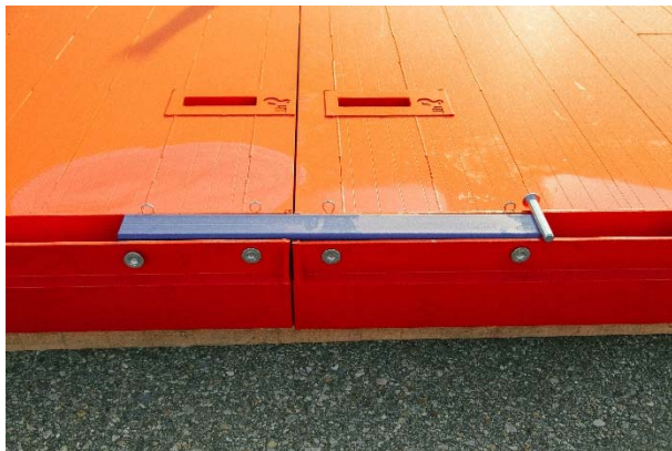
spojenie základného boxu s nadstavbou

Za 20 minút je box s nadstavbou plne zložený.