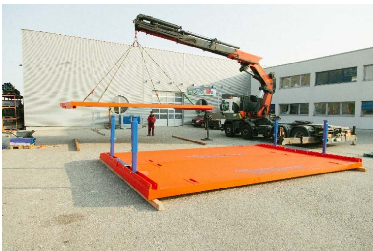
montáž druhej zostavy platní