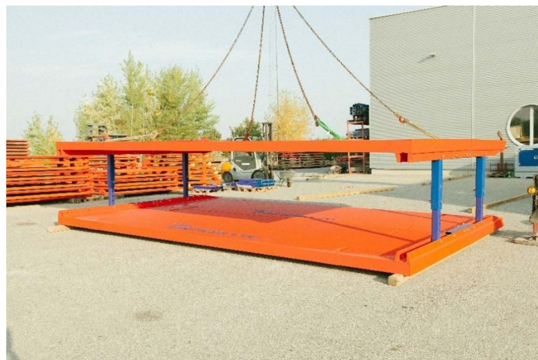
konečná montáž boxu – pripravený na prevádzku