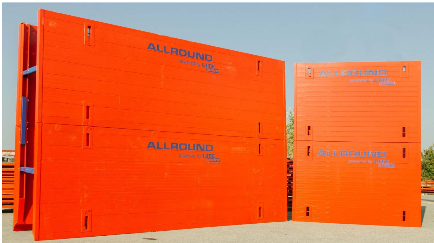
Vľavo 7200 mm dlhý Super-Size-Box, vpravo 3600 mm dlhý ALU-Super-Box, vrátane nadstavbových elementov.

Pre všetky typy ALU hliníkových pažení sú k dispozícii aj nadstavbové boxy s tými istými rozmermi. Takto je možné pri použití boxov realizovať maximálnu vstavanú hĺbku 4,8 metra na maximálnu dĺžku boxov 7,2 metra.