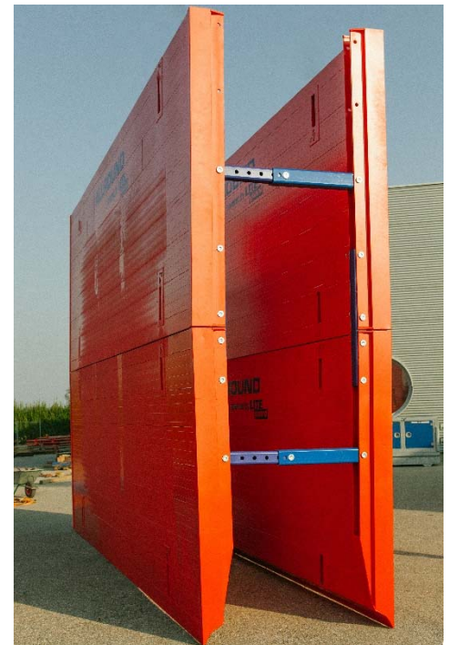
ALU-SUPER-SIZE-BOX s nadstavbou: *7200 mm dĺžka x 4800 mm výška *váha 4 tony

Samozrejme sme ostali naďalej plne verní nášmu základnému princípu, a to dať používateľovi k dispozícii jednoduchú, robustnú a dlhodobú techniku kvalitných pažiacich systémov.