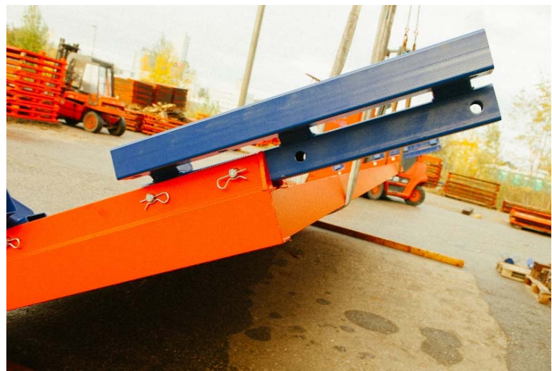
ALU šachtové paženie (dĺžka 7200 x šírka 3600 x výška 4800) pri hmotnosti len od 6 ton.