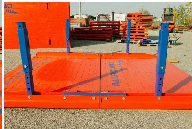
základná platňa boxu s nadstavbovou platňou